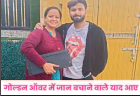
गोल्डन ऑवर्ट में जान बचाने वाले याद आए