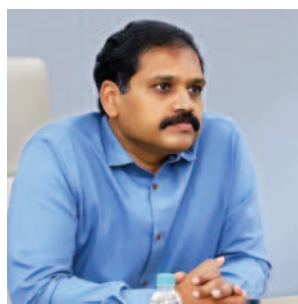
हैदराबाद, 27 जनवरी (स्वतंत्र वार्ता)। साइबराबाद पुलिस